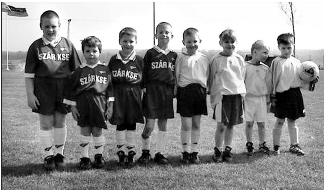
Nem lehet elég korán elkezdni

– Az utazások, a helyi labdarúgó tornák megszervezése, az egyesület anyagi