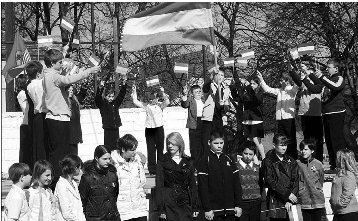
Március 15-én a Romhányi György Általános Iskola tanulói adtak műsort a szári szabadtéri színpadon

Szár és Újbarok önkormányzatának lapja XII. évfolyam • 3. szám • 2008. március