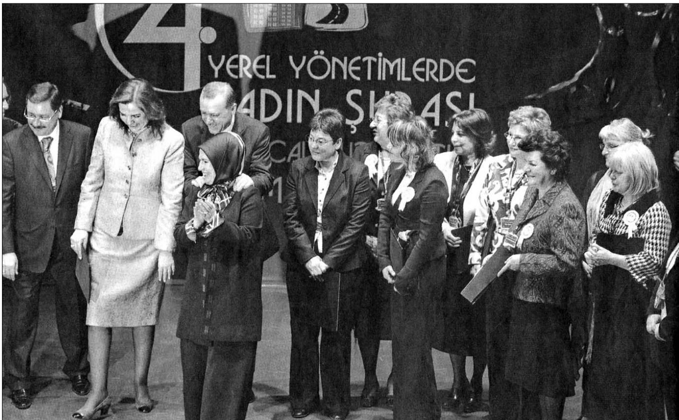
Csoportkép a tanácskozás résztvevőiről, a felvétel jobb oldalán a szári polgármesterrel. A fotót a Zaman című török napilap közölte a konferenciát követően