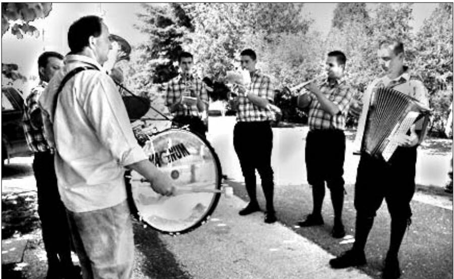
... és a Lustige Buam zenekar is hozzájárult a rendezvény sikeréhez