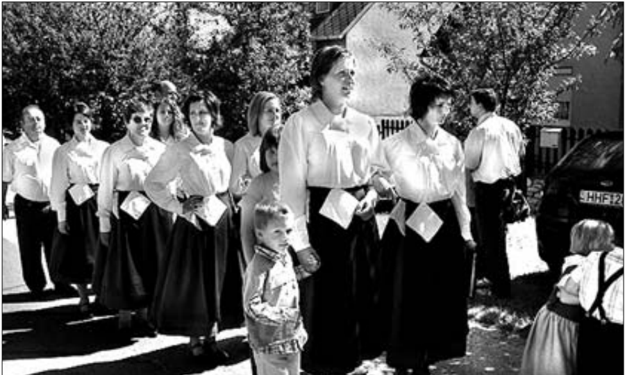
Az újbarki nemzetiségi kórus...

A hagyományokhoz híven ezen a napon is volt felvonulás, melyhez az újbarki Lustige Buam zenekar muzsikált. Utána a vendég és hazai csoportok mutatták be műsorukat. Megcsodálhattuk a mányiak és zsámbékiak táncát. Szárról három táncos csoport is fellépett, amelyek tagjai között több újbarki gyerek is szerepel. Szépen zengtek nemzetiségi népdalkörünk dalai, és nagy tapsot kapott a zenekarunk is.