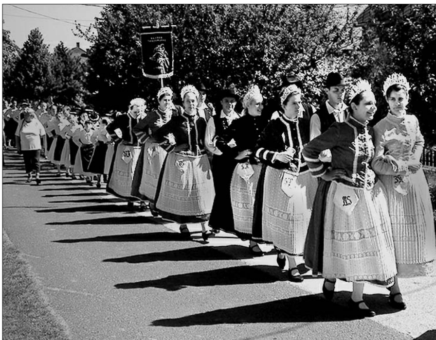
Az újbarki pünkösdi fesztivál vendégei között felvonultak a zsámbékiak is