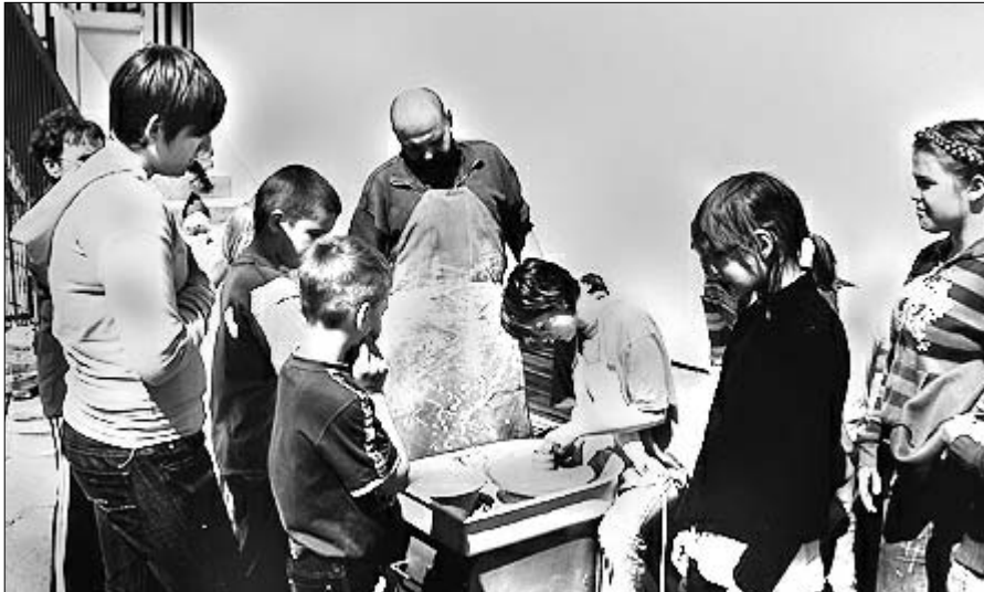
A korongozás sokakat érdekelt

A kézműves délután 12.30-kor kezdődött volna, de már egy órával előtte gyülekeztünk a folyosón. Így fél 12-kor neki is láthattunk. A foglalkozások két tanteremben és az udvaron zajlottak.