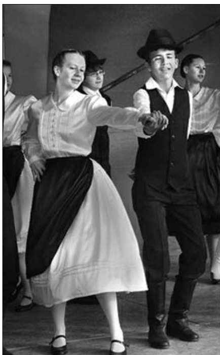
Táncosok a szári majálison

Szár és Újbarok önkormányzatának lapja XII. évfolyam • 5. szám • 2008. május